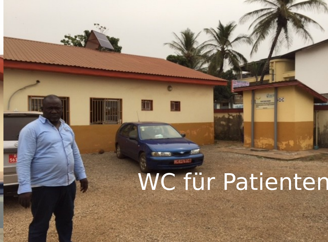
WC für Patienten